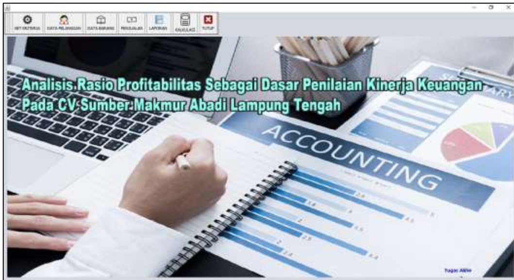
Gambar 3 Form Menu Utama