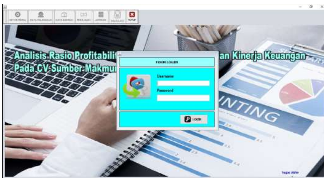
Gambar 2 Tampilan Halaman Login

Implementasi halaman login admin, halaman login pengguna digunakan untuk masuk kedalam sistem, username dan password yang sudah ada ketika sistem yang digunakan maka secara otomatis username dan password disediakan dan dapat masuk kedalam Analisis Rasio Profitabilitas Sebagai Dasar Penilaian Kinerja Keuangan Pada CV Sumber Makmur Abadi Lampung Tengah, untuk implementasi halaman login admin dapat dilihat pada gambar 4 sebagai berikut: